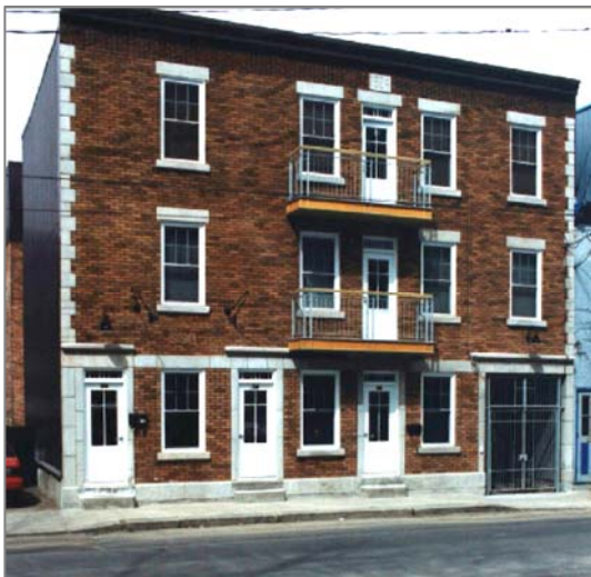
Premier siège social